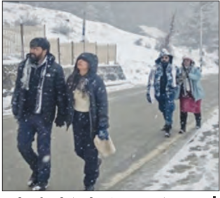
भारी बर्फबारी के बीच शिमला पहुंचे सैलानी।